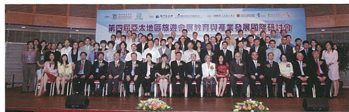
The Faculty hosted 「The 4th International Conference on MICE Tourism Education and Industrial Development in the Asia-Pacific Region」

The program of Doctor of Philosophy in International Tourism Management trains tourism management professionals to develop an innovative spirit and academic research perspective. Students are required to complete 48 credits including four courses, dissertation and oral defense. Qualified students will be able to obtain their Doctor's degree in three years. The program brings together well-known professors, local and foreign, to teach and supervise dissertation. The professors provide a wide range of first-rate alumni network for students. Students can participate in international academic exchange activities of their choice. In addition, the Faculty provides opportunities for teaching and research assistants for outstanding students. Students who complete the whole program according to the requirements of the Faculty will be recognized by the Ministry of Education of the PRC.