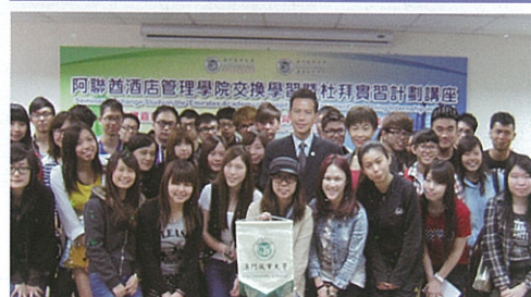
阿聯酋酒店管理學院交換學習暨杜拜實習計劃講座