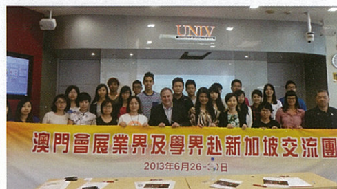
澳門會展業界及學界赴新加坡交流團 2013年6月26-27日