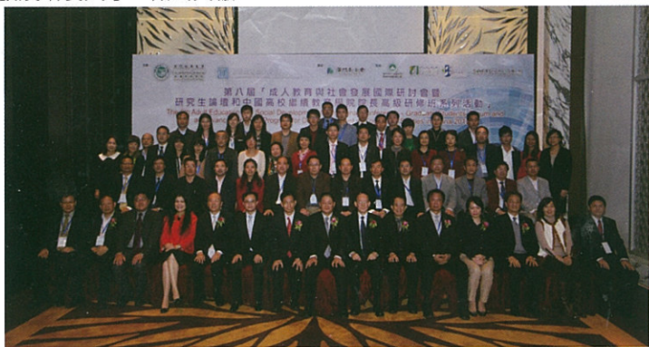
▲第八屆成人教育與社會發展國際研討會參與者與嘉賓合照

澳門自1999年回歸後，隨著中央政府及特區政府對澳門教育的大力支持，澳門已經成為國際化水準較高、經濟蓬勃發展、知識經濟主導的社會。在此同時，隨著終身學習的理念已逐漸被廣泛社會大眾所接受，發展高等教育也成為澳門社會提升人才素質的重要方式。2011年，亞洲(澳門)國際公開大學在經歷卅餘年的成長與茁壯歷程之後，在陳明金先生的努力下成功改制成為非牟利性質的澳門城市大學，以嶄新的姿態出現在澳門高等教育界，期許為澳門社會穩定和經濟發展培養人才，做出貢獻。