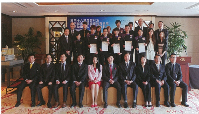
▲2013年5名優秀學員榮獲十六浦度假村的升職獎勵

現時，澳門部份大學生為了進行兼職工作，荒廢學業，更有不少中學生受到高收入行業的誘惑，放棄大學學習機會。同時，也有學生因經濟困難而放棄升學。為此，近年來學院與十六浦和澳門喜來登成功合辦了一系列『產學結合暨人才發展計劃』，去年更聯同澳門喜來登金沙城中心酒店開設不含博彩元素的『喜來登-助學暨人才發展計劃』。透過與國際知名企業和大學的緊密結合，為有志完成大學學業的同學提供繼續晉升優質高等教育課程的機會。在勤工儉學，自食其力地完成學業後，學生不僅能夠獲得大學學士/碩士學位、豐富的行業經驗，更能比其它大學畢業生擁有更理想的發展及晉升機會。