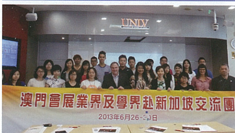
澳門會展業界及學界赴新加坡交流團 2013年6月26-30日