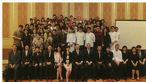
▲ 2014年參加“喜來登助學暨人才發展計劃”的優秀學生，完成第一階段的實習表彰大會