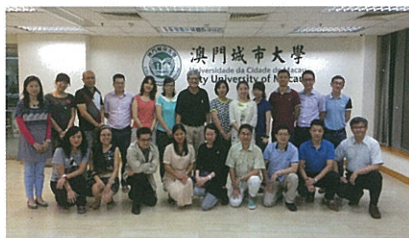
▲台灣高雄師範大學副校長吳連賞教授來為教育學博士授課