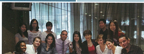
澳門城市大學 City University of Macau 來自佛羅里達國際大學的首批交換學生與國際旅遊與管理學院 師生共聚 FITM Faculty Members and students gathered with FIU first batch of internship students.