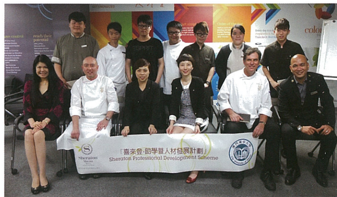
▲2014年7名參加「喜來登助學暨人才發展計劃」的優秀學生，在9個月後獲得了晉升