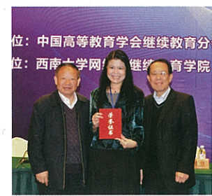
▲澳城大學者獲2013中國高等教育學會繼續教育論文一等獎