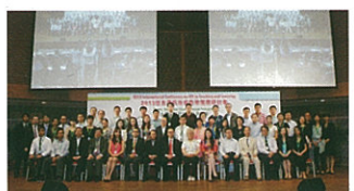
▲與香港大學合辦2013信息通訊技術教學國際研討會