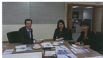
The Faculty signed letters of intent with prominent universities in the United States (right below), Switzerland (left above), France (left below), Dubai (right below) and others