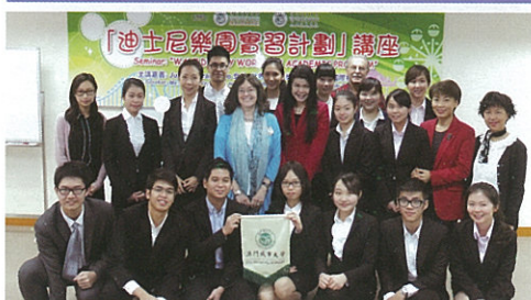
「迪士尼樂園實習計劃」講座