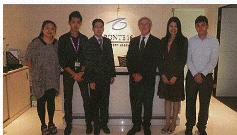
▲ 聯合國世界旅遊組織評鑑代表到實習資助機構探訪管理實習生