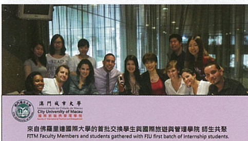
來自佛羅里達國際大學的首批交換學生與國際旅遊與管理學院師生共聚 FITM Faculty Members and students gathered with FIU first batch of Internship students.