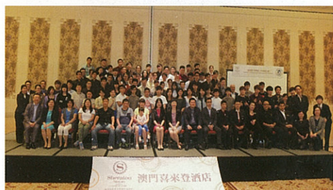
▲ 2014/2015和2013/2014學年兩屆學生參加“喜來登助學暨人才發展計劃”開學禮