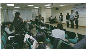
▲澳城大教育學院學生積極參與教育學研究生論壇